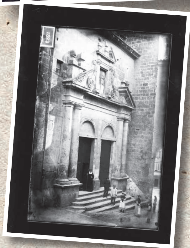
📷 Puerta Catedral (1910 aprox) (Carlos Sarthou Carreres)