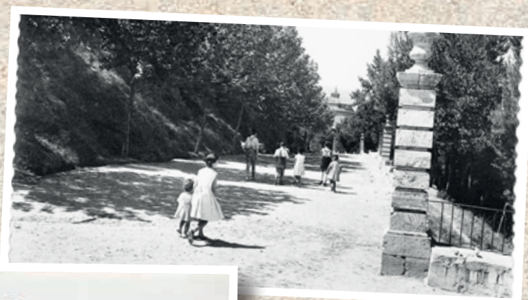
📷 Sopena (1950 aprox) (Daniel Arbonés Villacampa)