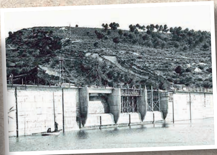
📷 Pantano Regajo (1960 aprox.) (Diputación Castellón)