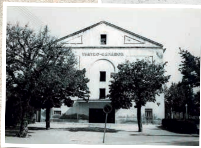
📷 Teatro Camarón (1972aprox.) (Wenceslao Ricart)