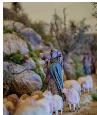
en dicho acto o representados en el mismo.

El jurado visitará los belenes participantes el 11 de diciembre, emitiendo su fallo el día 15 del mismo mes en un acto público, a las 19:30 horas en el Salón de los Alcaldes del Ayuntamiento. Con anterioridad a la entrega de premios, se comunicará a los ganadores el fallo del jurado, debiendo estar presentes