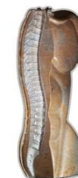
-Categoría Internacional- Premio FRANCISCO RIBALTA 2023 "Artesis" Autor: Antonio Fernández García