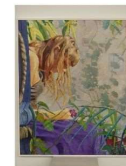
-Categoría Comarcal- Premio ALTO PALANCIA 2023 "Plácida mañana" Autor: Rafael Ardit Mínguez