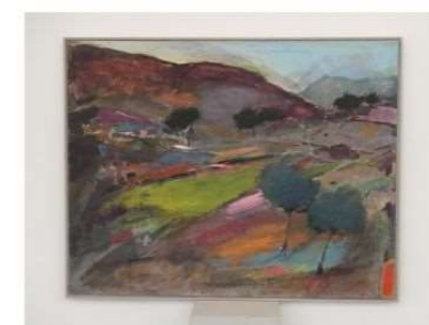
-Categoría Internacional- Premio FUNDACIÓN BANCAJA Segorbe 2023 "Paisaje con prosa" Autor: Manuel Sebastián Navarrete