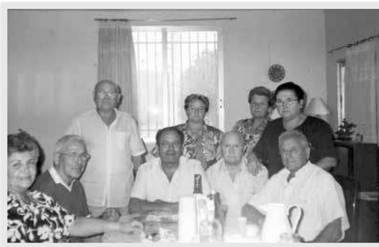
Comida de familiares y amigos