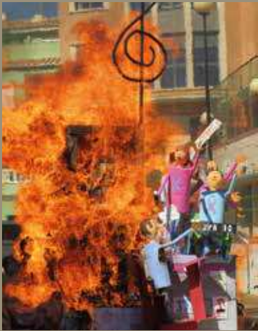
La falla en llamas

El Centro Ocupacional de Segorbe celebró el pasado 15 de marzo su tradicional y manufacturada falla. Un año más, usuarios y profesionales sorprendieron con un monumento fallero muy elaborado, bajo el lema "la música es la banda sonora de la vida". En esa línea, el Centro recibió al público al ritmo de batukada, coordinados