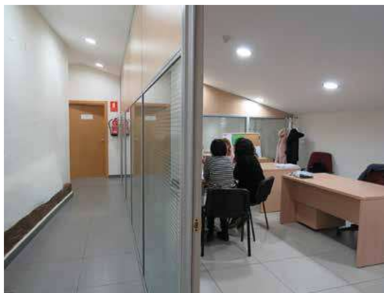
📍 El punto de coordinación contra la violencia de género ya está en marcha

Las mujeres que necesiten de este servicio podrán acceder a él desde el 016, y también en el 900 58 08 88. Este servicio presta atención 24 horas al día, aunque de manera presencial el horario de las profesionales en el mismo