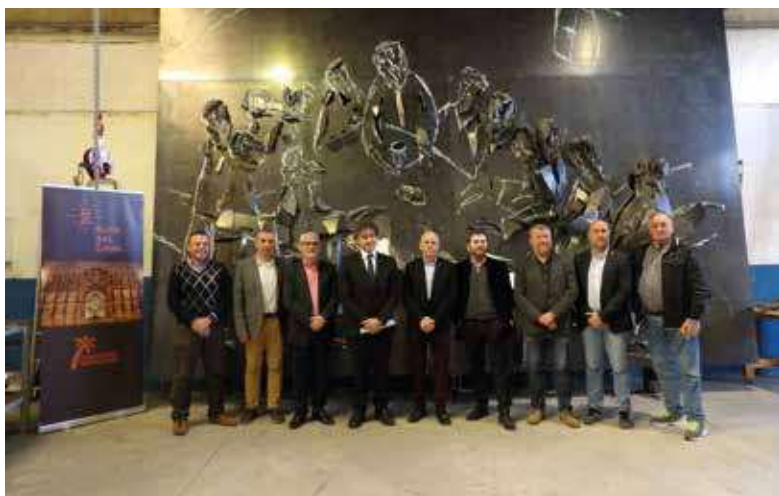
El artista que ha realizado la escultura, junto al Secretario Autonómico de Turismo y alcaldes de los municipios del Grial