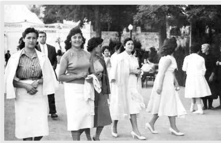
Amigas de Segorbe en la Glorieta