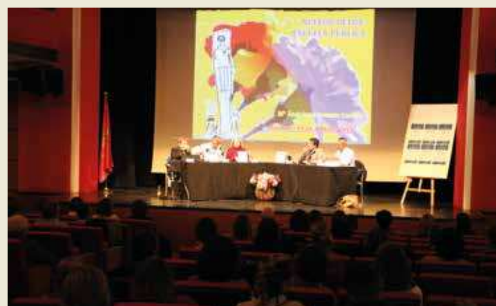
⌚ Alrededor de 200 personas acudieron al Serrano para el interesante debate entre todos los ponentes

En un debate con muchos argumentos y propuestas, se trataron entre otros temas: los necesarios consensos en educación, formación permanente del profesorado, trabajo coordinado y colectivo de todos los actores e instituciones implicadas, derecho de formación a lo largo de toda la vida (formación de adultos), la disyuntiva de la escuela selectiva a la inclusiva, o uno de los temas más olvidados como es el de cómo enseñar a cómo aprender, pues se habla mucho de cómo se puede mejorar para enseñar pero poco de cómo mejorar el que los alumnos aprendan.