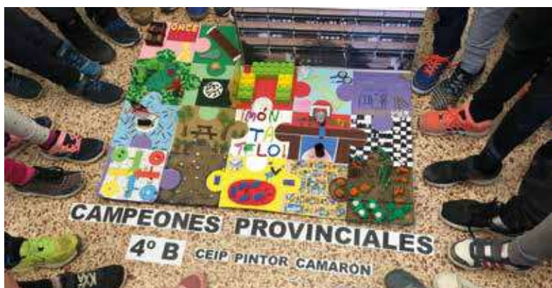
⌚ El trabajo mereció el primer premio provincial