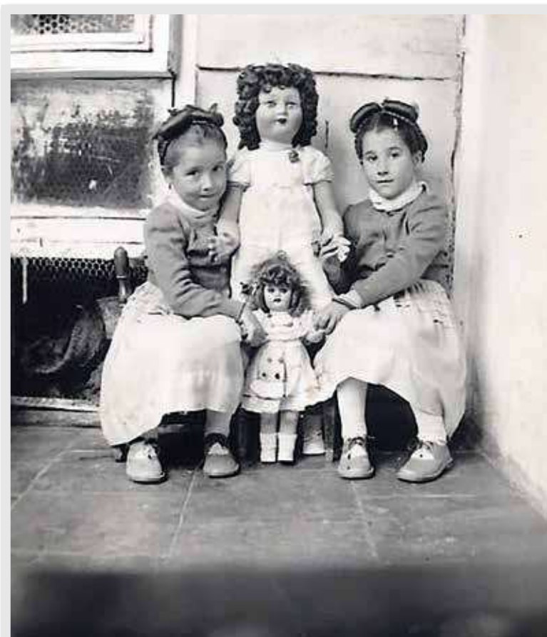
Hermanas jugando con sus muñecas, año 1954