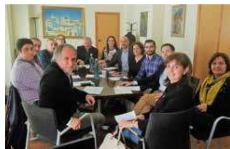
Reunión mantenida entre el director territorial y diversos alcaldes

Las trabajadoras afectadas por los impagos por parte de la empresa Raspeig, que es la concesionaria de muchos centros educativos en la provincia de Castellón, levantaron la huelga a mediados de marzo aún sin haber cobrado el mes de diciembre y el de febrero.