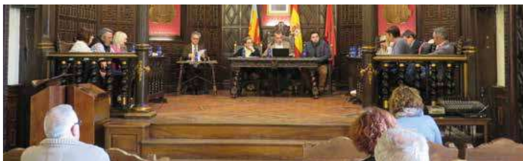
Pleno extraordinario en el Ayuntamiento de Segorbe

El resto de cuantías se dividen, entre otros, en la mejora de las instalaciones del Segóbriga Park, la adquisición de instrumentos para el conservatorio, el acondicionamiento de zonas verdes, la senda intracomarcal, las inversiones en agricultura, subvenciones a asociaciones por su labor en el municipio, programación