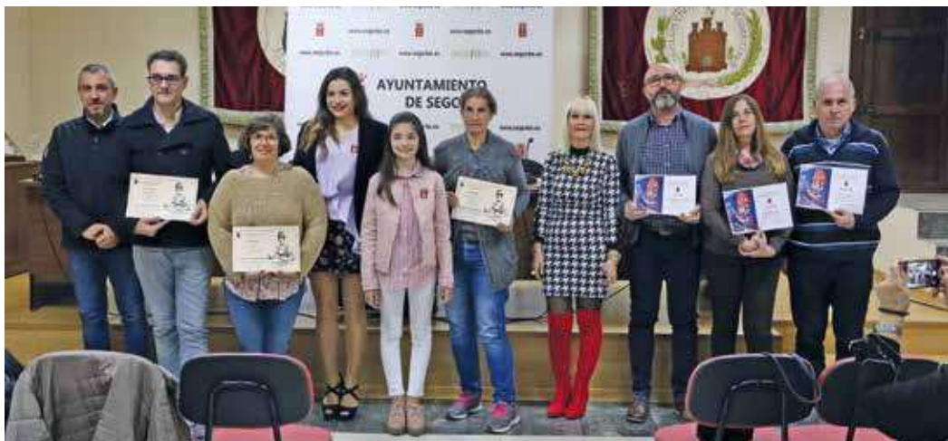
🕒 El Salón de los Alcaldes fue el lugar escogido para la entrega de premios