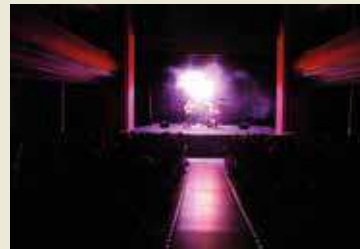
Las XL ofrecieron un espectáculo musical

El domingo 31, con el horario de verano recién estrenado, con 150 personas de público, el Teatro Serrano fue escenario de la actuación de Las XL y su obra "Abandónate mucho", una comedia músico teatral que deconstruye el mito del amor romántico. La obra es un