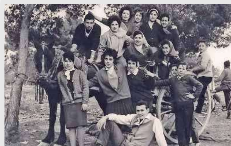
Amigos en el Pinar, años 60