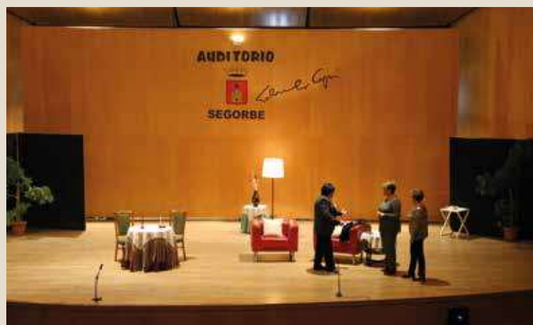
🕒 Representación organizada por la Asociación de Mujeres

Si fuéramos iguales, los puestos directivos en las empresas estarían repartidos.