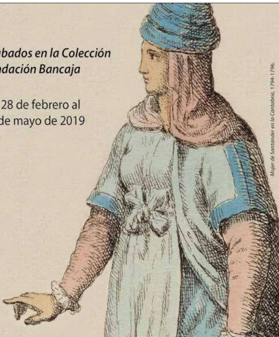
Mujer de Santander en la Cantabria, 1794-1796.