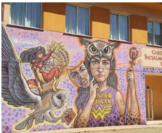
El mural de mayor tamaño de los diversos que se realizaron

En las paredes que rodean el patio del centro también se pintaron palabras y dibujos representando la igualdad, respeto y la sororidad. Así, el instituto abrió sus puertas dos tardes para que cualquier persona del profesorado, alumnado o de sus familias que por horario no pudieron participar en la tarea pudiesen hacerlo. A través de las palabras de la alumna se agradeció el apoyo económico del Ayuntamiento para esta iniciativa.