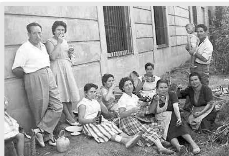
Grupo de amigos de Segorbe en 1954