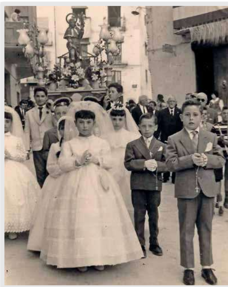
Procesión del Corpus de Segorbe, vecinos del barrio de San Roque, año 1962