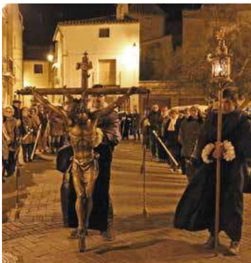
Ⓐ La Procesión del Silencio es uno de los primeros actos de la Cuaresma

ración espiritual de la fiesta de la Pascua. La Procesión del Silencio tiene como origen los cinco misterios dolorosos y las 14 estaciones del Viacrucis.