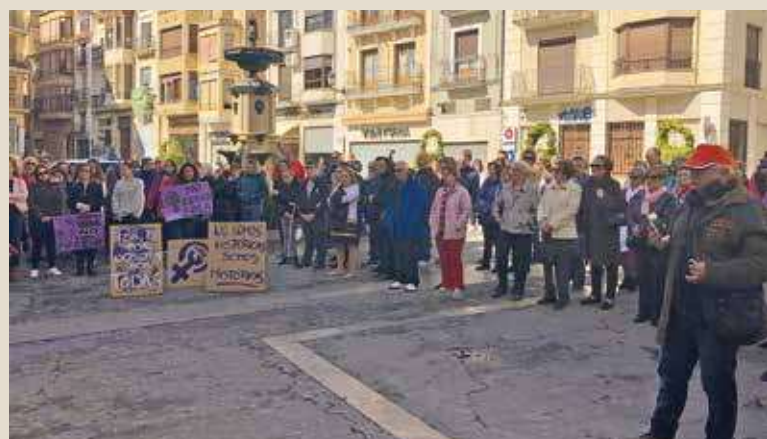
🕒 Asistentes al manifiesto por el Día de la Mujer en Segorbe

Si fuéramos iguales, daríamos la misma oportunidad de estudiar a las mujeres que a los hombres.