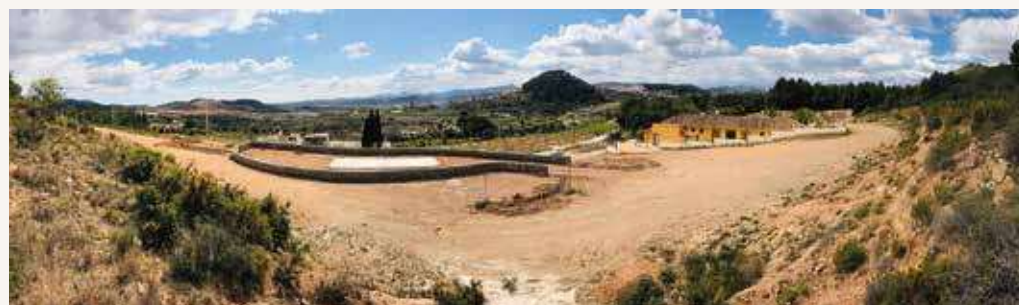
Vista del terreno de Cárrica donde se efectúa la obra

Por otro lado, como ya se anunció, este verano se espera poner en funcionamiento el servicio de bar de la piscina. Por ello, cualquier persona interesada en su gestión puede consultar el estudio de viabilidad económico-financiera que servirá de base para la licitación en el tablón de anuncios de la sede electrónica del Ayuntamiento de Segorbe.