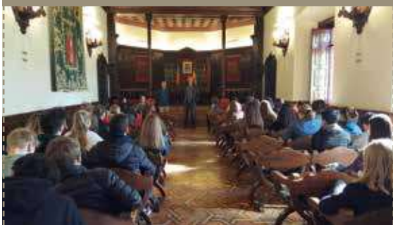
Recepción del alcalde en el Salón de Plenos del Ayuntamiento

Parte del estudiantado de bachillerato del instituto Alto Palancia vivió a mediados de marzo un intercambio con alumnado de la ciudad de Potsdam (Alemania). Un total de 25 estudiantes alemanes y 25 nacionales acudieron el día 13 a una recepción del alcalde de Segorbe, Rafael Magdalena, que se realizó en el Salón de Plenos del Ayuntamiento de la localidad. Además, el Consistorio facilitó la entrada gratuita al Centro de Interpretación de la Entrada de Toros y Caballos, pues la visita de estos jóvenes tenía el objetivo de que conociesen las festividades y los monumentos más representativos del municipio, así como realizar un intercambio cultural y lingüístico coordinado por sus centros educativos.