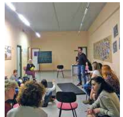
I Taller de Apego en el Centro de Salud de Segorbe, impartido por los Servicios Sociales

Según la citada teoría, las herramientas personales que tenemos para enfrentar dificultades en contextos sociales comienzan a adquirirse en etapas muy tempranas y en entornos íntimos, como es la familia. Tanto es así, que los Servicios Sociales de Segorbe han