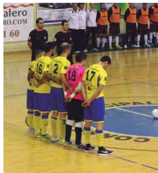
▲ El equipo, cogido para un minuto de silencio.

Y por lo que respecta a la liga interna "Asador Aguilar" hay que indicar que el equipo Club Paquis-Talleres Barrachina sigue encabezando la clasificación, seguido muy de cerca por dos conjuntos, Colchones Agustín Morro y los alturanos del Bar Alvis.