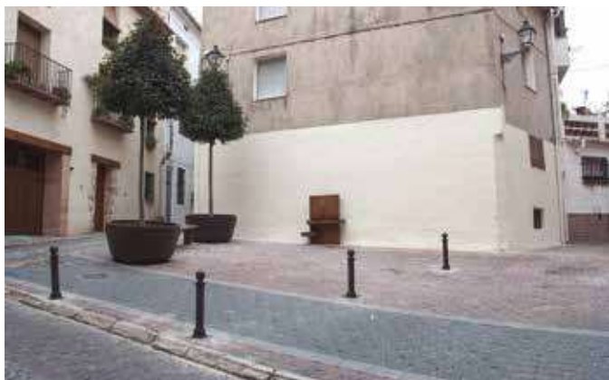
▲ La fuente de la Plaza San Antón.

El Ayuntamiento de Segorbe ha desarrollado una actuación de acondicionamiento ambiental de la plaza de San Antón, ubicada en pleno conjunto histórico, a los pies de la Torre de la Cárcel, uno de los monumentos de mayor relevancia patrimonial de nuestro municipio.