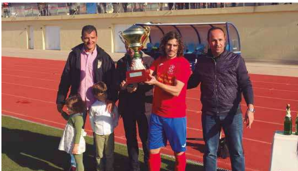
▲ Levantando la copa.