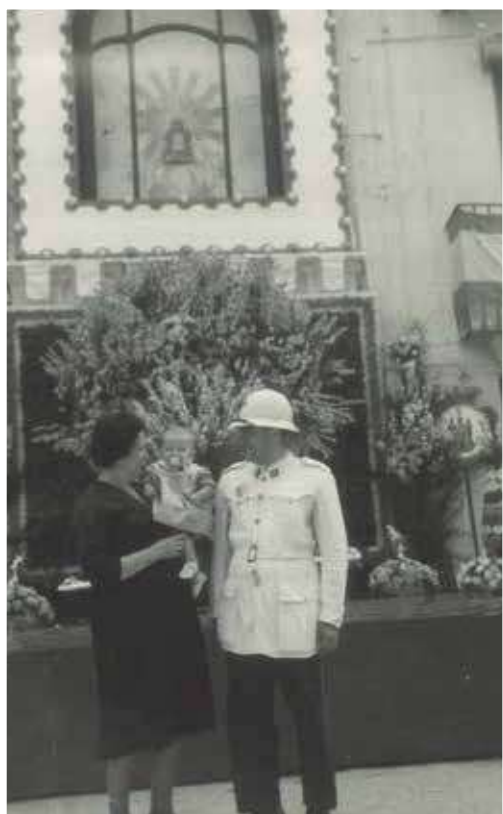
▲ Ofrenda a la Cueva Santa, años 60.