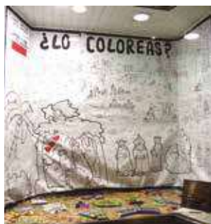
▲ Librería Athenas: Ganadora de la Categoría Calidad Artística

Hay una fecha que los comerciantes de Segorbe tienen marcada en el calendario, y es la Navidad. Por ello, visten sus escaparates con las mejores creaciones para atraer al público y celebrar estas fiestas.