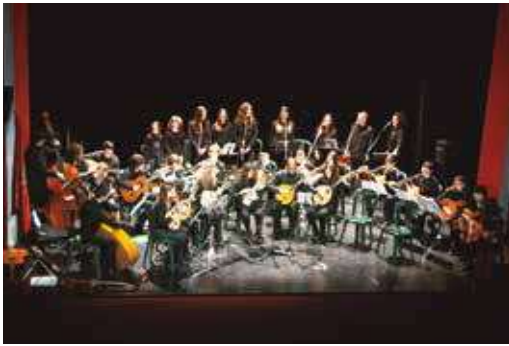
Concierto navidad Amigos de la Música y Escuela de Cuerda de Alcora.