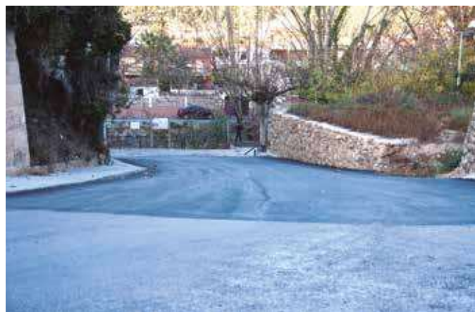
▲ En los 50 caños se ha asfaltado más trozo.

Por otro lado, aprovechando la estancia de las máquinas de pavimentación que estaban terminando