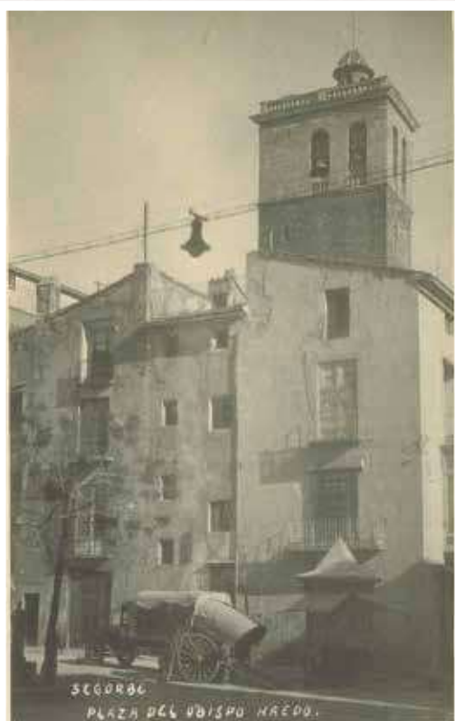
▲ Postal de la Plaza Obispo Haedo, años 20.