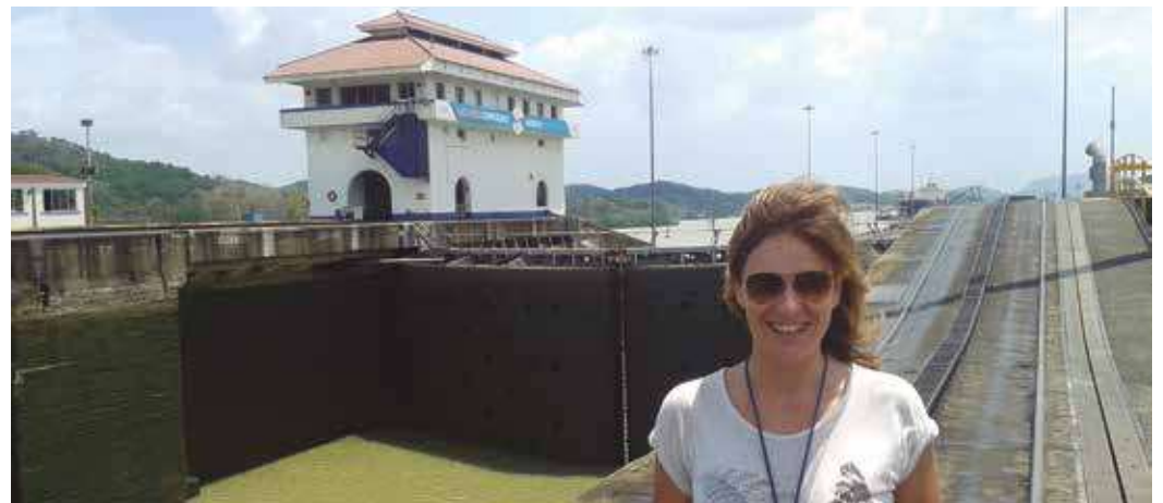
▲ En el Canal de Panamá.

¿Qué es lo que más echas de menos de Segorbe?