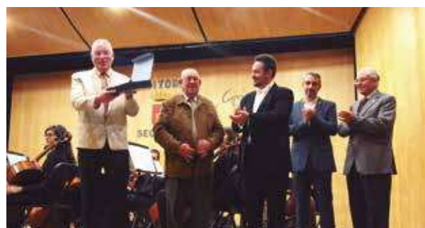
▲ Algunos de los ganadores con sus placas.