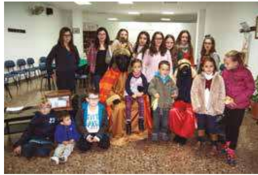
Visita del Cartero Real a Cárrica y Segorbe.