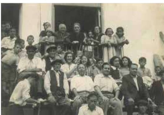
▲ Tarde de vacas en el entablo, años 50.