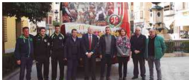
Representantes del Club, del Ayuntamiento y de la empresa de autobuses.

La Entrada de Toros y Caballos de Segorbe acompañará al Club Deportivo de Fútbol Sala de Segorbe (CDFS) en todos sus desplazamientos, ya que el autobús que les lleva a los partidos se ha rotulado con la imagen de esta fiesta de Interés Turístico Internacional.