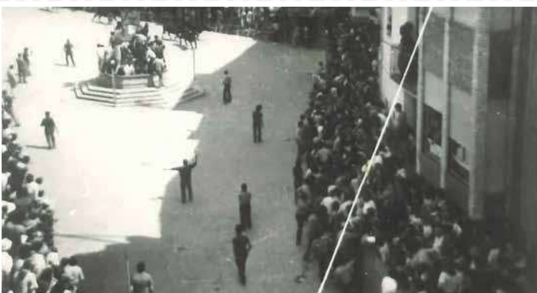
▲ Final del recorrido de la entrada Años 70.