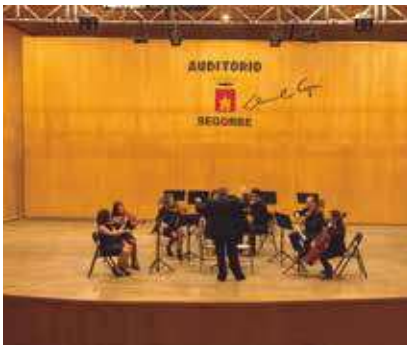
I Festival Origos, encuentros musicales Alto Palancia y Javalambres.