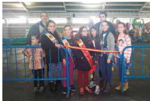
Inauguración Festival infantil con hinchables, atracciones, talleres.