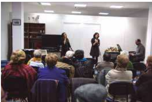
Espectáculo de música y teatro en el Edificio Rascaña de Peñalba.