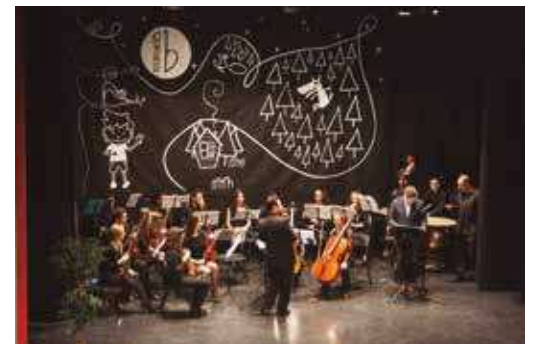
Cuento musical para niños PEdro y el lobo.