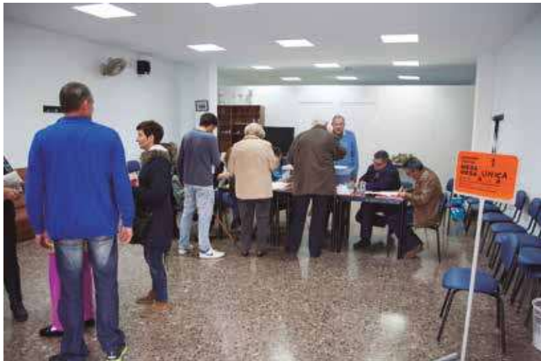
▲ En la mesa única votaron los vecinos de Cárrica.

El pasado 20 de diciembre, la pedanía de Cárrica vivió un día de fiesta, según la mayoría de la gente que se acercó a votar al Edificio Rascaña. Y es que ninguno de sus habitantes había votado "en casa" en unas elecciones desde que se instauró la Democracia.