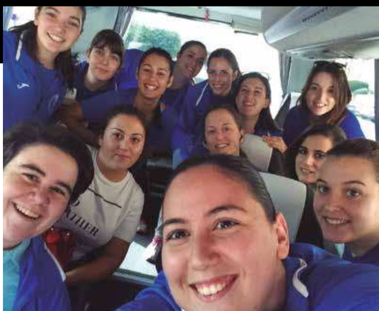
▲ Selfie del equipo femenino de cámino al partido.

Nos encanta tenerte con nosotros, cada día se aprende de ti, no solo por tus sistemas sino por tus ganas y motivación.