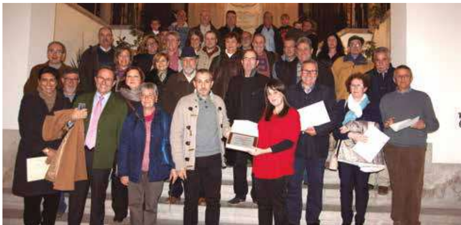
⬆ Todos los premiados posaron juntos para una foto de recuerdo.

El Centro de Transfusiones de la Comunitat Valenciana premió la generosidad de los donantes de sangre más veteranos en un acto celebrado en el Ayuntamiento de Segorbe. Por ello, entregó más de 50 medallas, 6 de ellas de oro y el resto de plata.