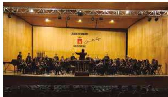
▲ Los alumnos tenían preparada una sorpresa para el público.

que dieron una sorpresa al público. Mientras el director estaba sentado frente a las sillas que debían ocupar sus alumnos, estos fueron entrando por las puertas del auditorio agrupados por instrumentos, versionando una de las canciones más escuchadas del verano, "El perdón", de Enrique Iglesias y Nick Jam. Una sorpresa que hizo sentirse al público parte del concierto al estar rodeados por los mú-