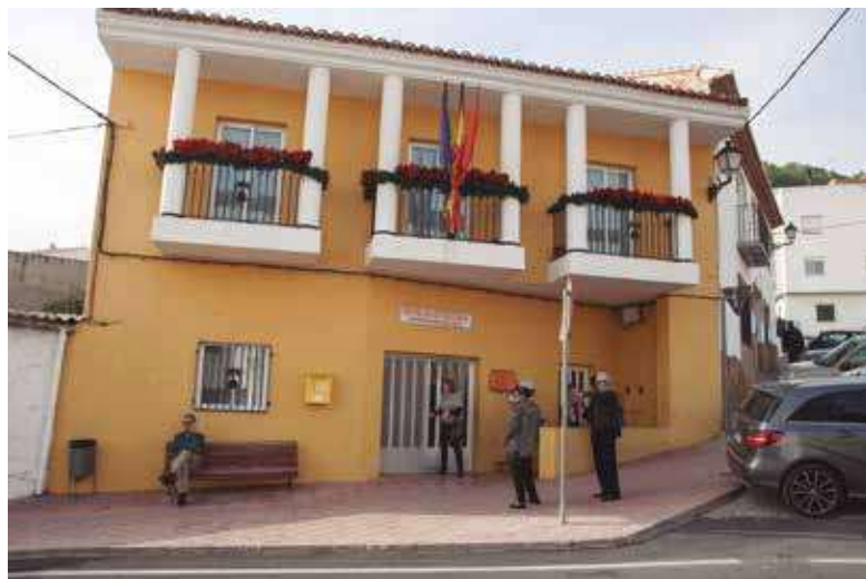
▲ El edificio Rascaña fue donde pudieron votar los vecinos.

no ir a votar en las anteriores tres elecciones al Congreso, en esta ocasión sí que iba a participar al encontrarse la urna en su pueblo y no verse en la obligación de desplazarse a