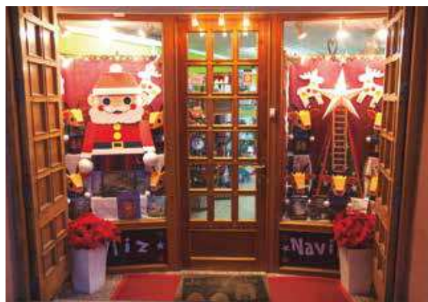
▲ Librería Agua Limpia: Ganadora de la Categoría B.