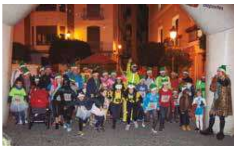
▲ Salida de la San Silvestre.

personajes de moda como los Minions o incluso a Darth Vader, que dejó de lado el estreno de su séptima película en los cines para participar en la carrera.