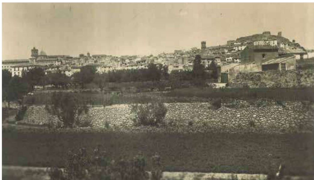
▲ Vista general de Segorbe en 1950.