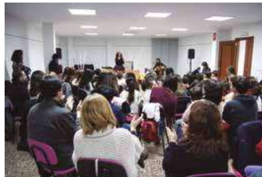
Fiesta Infantil en Peñalba con juguetes mágicos.