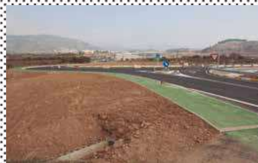
▲ La nueva rotonda de la CV-200.

De esta obra no sólo se beneficiarán los usuarios de Segorbe y Castellnovo, sino los de los pueblos cercanos que pasan por ese tramo para llegar a Segorbe como son Peñalba, Algimia de Almonacid, Vall de Almonacid, Matet, Almedijar o Aín, entre otros.