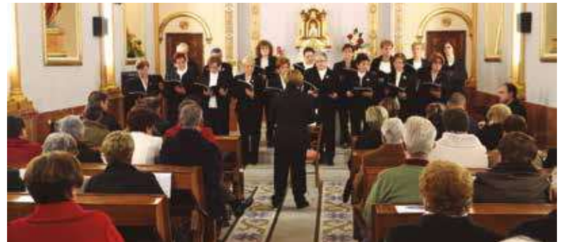
Concierto de villancicos. Coro de la Catedral Basílica.