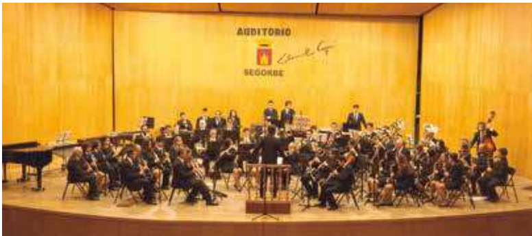
Concierto de Navidad de la Sociedad Musical de Segorbe.