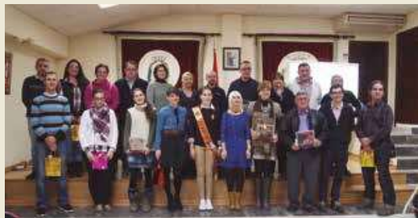
▲ Todos los premiados posaron con las autoridades.

Coincidiendo con la Navidad, el Ayuntamiento de Segorbe realizó la gala de Entrega de Premios Reconocimiento al Comercio "Ciudad de Segorbe".