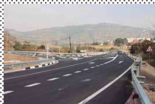
▲ El carril para desviarse hacia Peñalba.