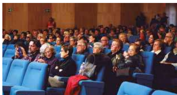
▲ Los mayores se volcaron con las actividades y hubo mucha asistencia.

El día 21, se celebró una nueva actuación en la Residencia de Personas Dependientes del Alto Palancia en homenaje a los mayores a cargo de la Coral Polifónica CEAM Segorbe.