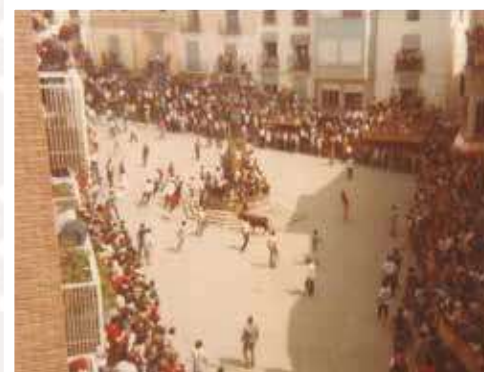
▲ Tarde de vacas, años 80.

¿Tienes fotos antiguas que te gustaría publicar?