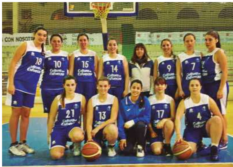
▲ El equipo Femenino.