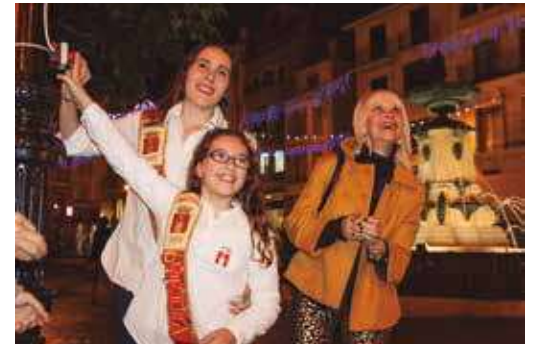
Encendido de las luces de navidad.