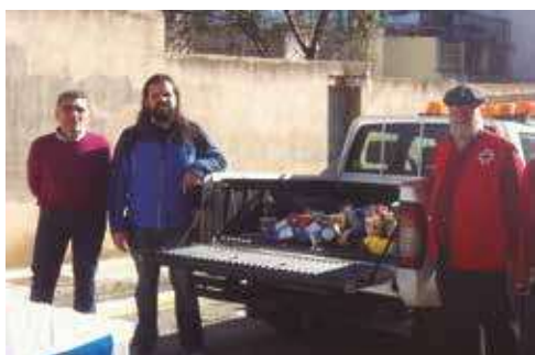
▲ Los alimentos recaudados fueron para Cruz Roja.

El sábado 26 de diciembre, el Club Triatlón Alto Palancia organizó una jornada de natación con un doble fin. El primero, disfrutar de una larga mañana deportiva y, el segundo, animar a la solidaridad recogiendo comida para el banco de alimentos de Cruz Roja.