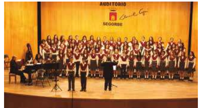
Concierto CORO pequeños cantores de Valencia organizado por Asociación Navarro Reverter.