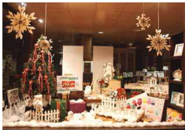
▲ Carpintería Andueza: Ganadora de la Categoría A.

El concurso tiene un tercer premio, el de la calidad artística, que fue para la Librería Athenas, por la cantidad 150 euros y una placa.