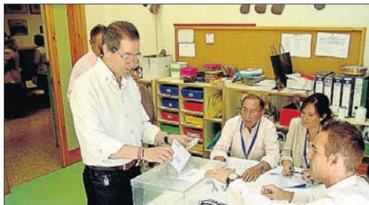
El alcalde de Segorbe votó en las aulas de Infantil del Pintor Camarón.