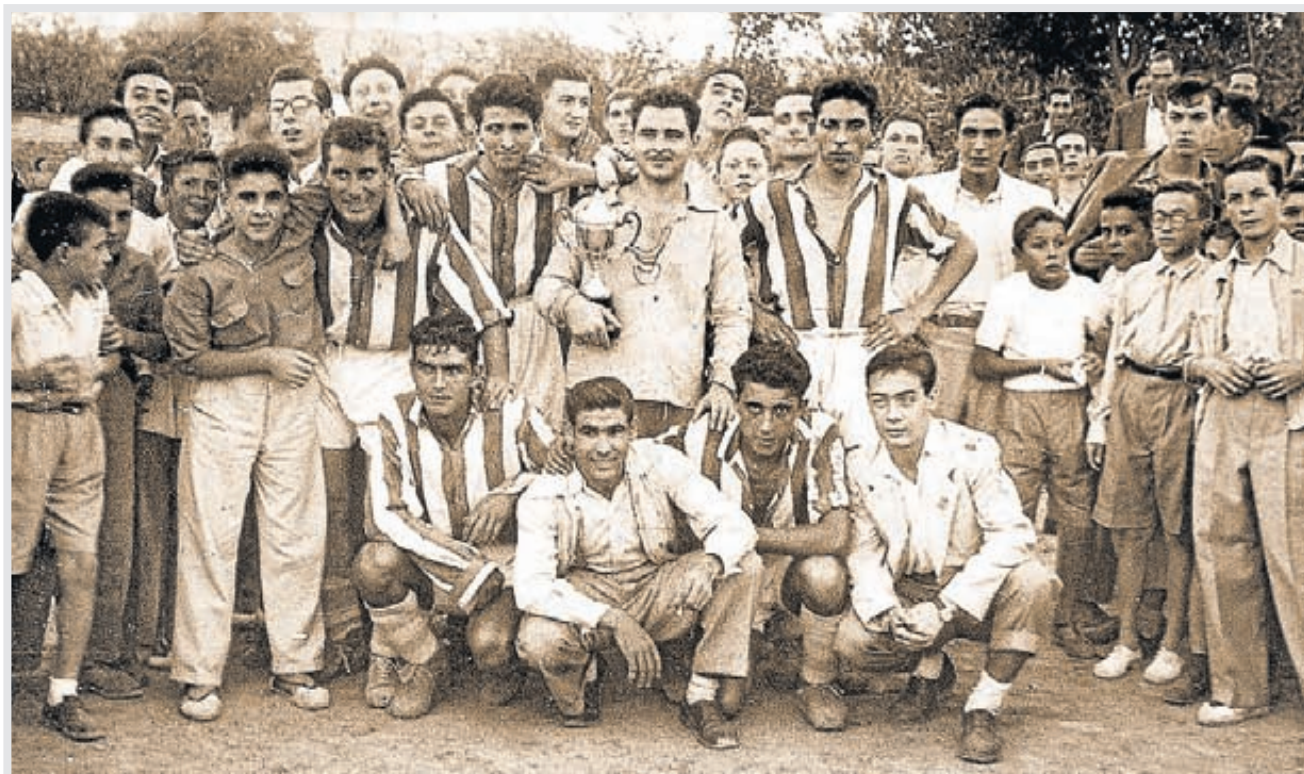
El equipo segorbino, en una imagen tomada en el año 1949.