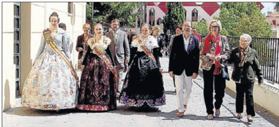
Las autoridades municipales inauguraron una exposición en el Centro Cultural.

la Asociación de Bolilleras de Segorbe, exposición que permaneció abierta hasta el 3 de mayo.