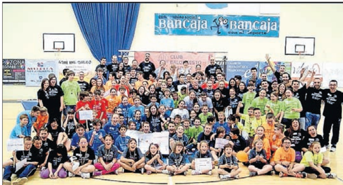
El torneo interescolar contó con una elevada participación por parte de los jóvenes deportistas.

De muy satisfactoria cabe tildar la temporada de los equipos del Club Baloncesto Segorbe, en un año que ha supuesto el relanzamiento de los mismos con renovadas energías. El equipo sénior en categoría Preferente, en una liga muy competida e igualada, acaba con un balance de 14 victorias por 12 derrotas - 6º de 14 - con muchos de los partidos resueltos a favor o en contra por escaso margen de puntos y un potencial de crecimiento sin límite. El equipo sénior en categoría 2ª zonal finaliza la liga en 6ª posición de 11 contendientes, con un balance de 10/10 que hubiéramos firmado a ciegas al principio de temporada, un equipo que se va a ver nutrido el próximo ejercicio con la hornada de jugadores del equipo junior. Digna de alabar la progresión de los chavales del equipo junior, un grupo de chavales que a fuerza de batirse el cobre contra equipos de mayor potencial han asumido como propio el esfuerzo y la lucha, y éstos han dado fruto al final, disfrutando de sufridas y merecidísimas victorias como la obtenida a domicilio en Bétera en la jornada que cerraba la liga, ganando de 10. El equipo cadete, en la competición de Iniciación al Rendimiento, se ha destapado como un equipo aguerrido frente a rivales de mayor físico, en ésta segunda fase de la competición, que nos ha llevado a localidades como Vinaròs, Peñíscola o Benicàssim entre otras. La mayoría de ellos competirán en categoría junior