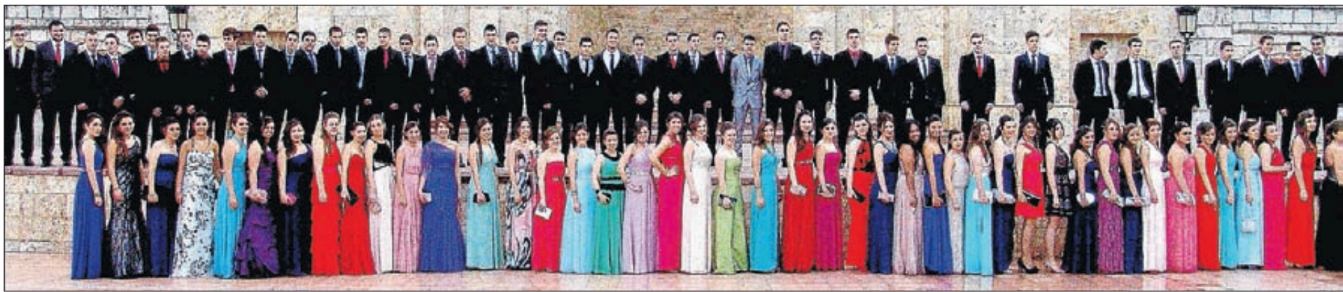
Los 120 bachilleres, que conmemoraban tan señalado día en su carrera formativa, siguieron el protocolo de la foto en el botánico y lucieron sus mejores galas para la ocasión.