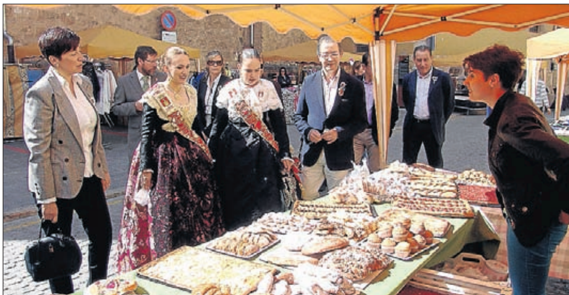
Las reinas y las autoridades locales de Segorbe inauguraron el XI Mercado de Oportunidades.

La Concejalía de Comercio mantiene su colaboración institucional con la aportación del montaje de los stands y la publicidad del evento, mientras que los comercios, por su parte, sufragaron los gastos de la ambientación infantil.