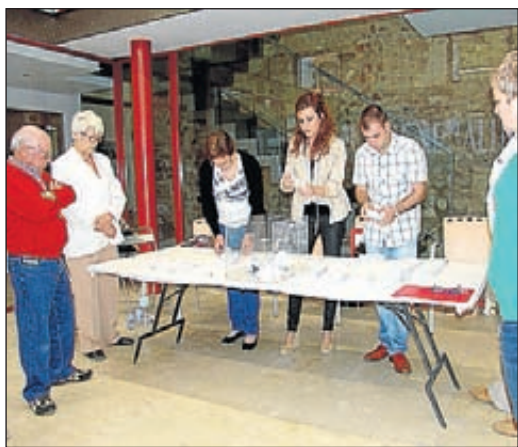
El número de candidaturas prolongó el recuento.