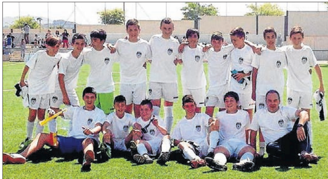
Los integrantes del equipo infantil A del CD Segorbe se proclamaron campeones de la categoría.

En cuanto al senior A, este año ha cumplido el objetivo de la permanencia, quedando los décimos en la tabla y sin presión como años anteriores, ya que a falta de cuatro jornadas el equipo ya había cumplido su objetivo. Ha sido un año difícil, con lesiones graves de jugadores importantes, falta de apoyo, problemas personales, pero pese a todo ello nos sobreponemos y disfrutamos los últimos partidos, en especial la victoria en casa de nuestro vecino el CD Altura, al