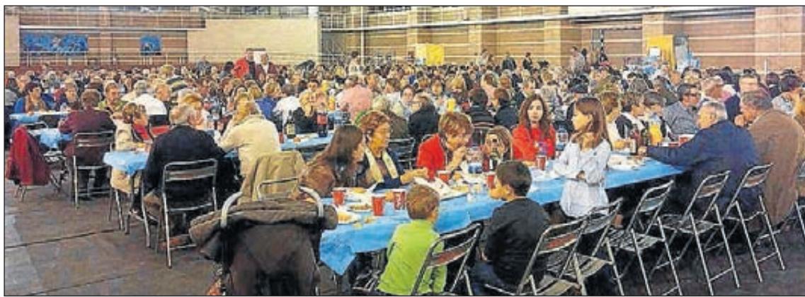
Manos Unidas tuvo una respuesta positiva a su convocatoria.

La cena benéfica contra el hambre, realizada el 25 de abril en la pista de atletismo cubierta de Segorbe, logró reunir a más de 500 personas. Esta es una velada a la que, año tras año, acuden muchos segorbinos y vecinos de la comarca.