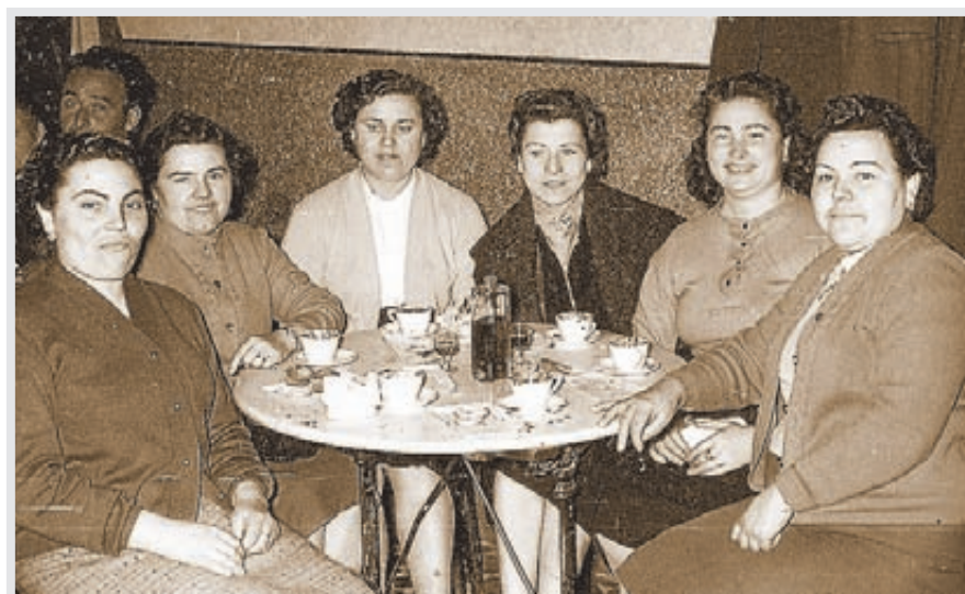
Tertulia de amigas a la hora del café.