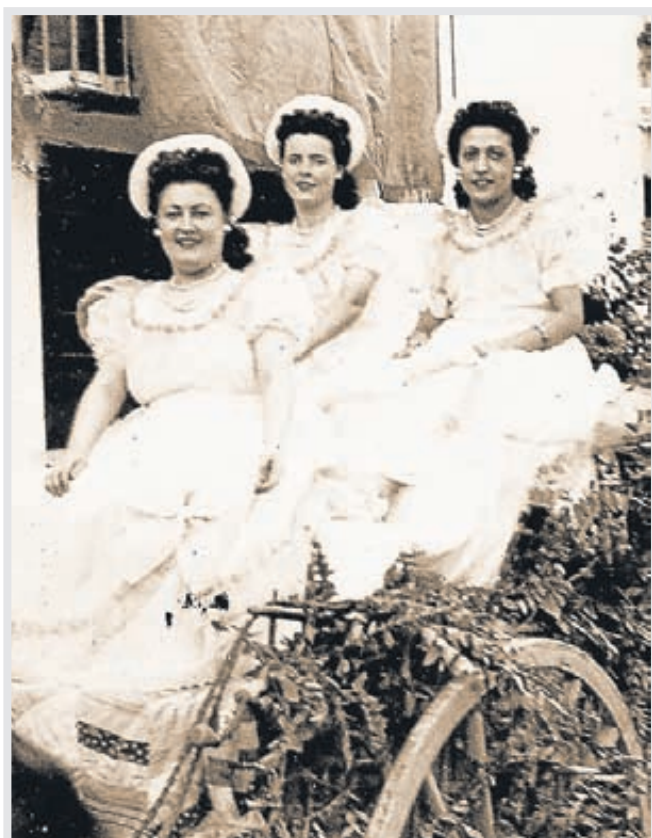
Cabalgata de fiestas de San Roque.