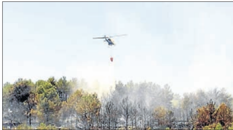
Los medios acudieron de inmediato, evitando males mayores.

Hasta el lugar de los hechos también se desplazó una dotación del Parque de Bomberos Profesional del Alto Palancia, las Brigadas Forestales de Jérica,