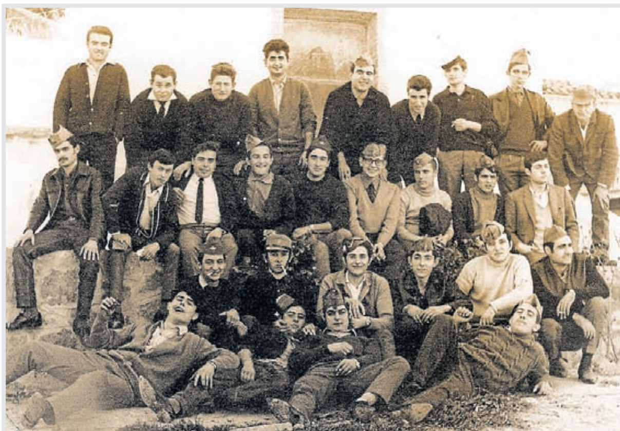
Una memorable estampa de grupo de los quintos del año 1968.