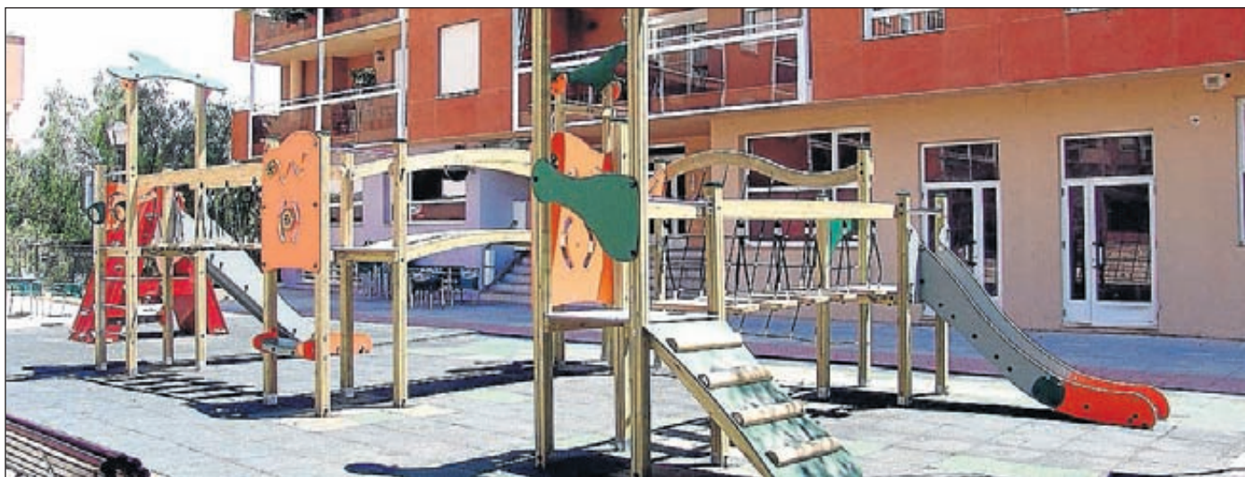
Imagen de los nuevos juegos infantiles instalados por el Ayuntamiento de Segorbe en la plaza de Francisco Vicent.

A través de la adquisición de estos columpios, las mejoras realizadas en los existentes y el mantenimiento continuo que se lleva a cabo de todos los juegos infantiles se consigue tener unos parques seguros y muy atractivos para los niños de todas las edades.