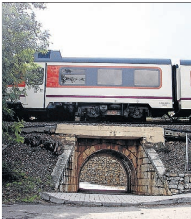
El corredor Cantábrico-Mediterráneo atravesará la comarca del Palancia.

Teniendo en cuenta estos datos, los presidentes autonómicos aseguraron que "se trata de un eje económicamente sostenible y que la clave es contar con un diseño en el que las mercancías sean prioritarias". Ambos se comprometieron a buscar fórmulas para apoyar "infraestructuras de futuro".