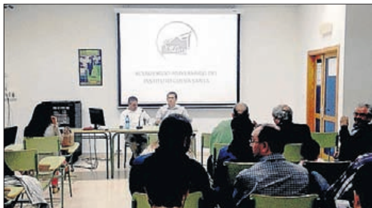
'Zona Cero' se publica con motivo del 60º aniversario del centro.