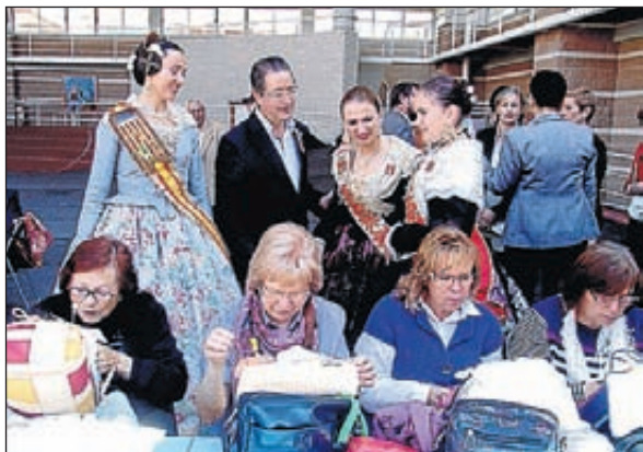
Alcalde, reinas, fallera y ediles recorrieron el recinto.