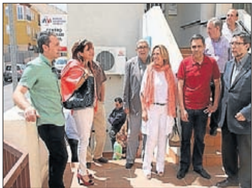
Trinidad Jiménez, en el mitin del PSOE.