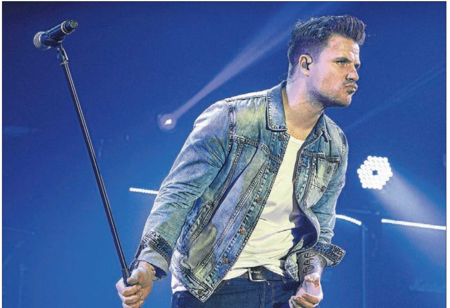
Dani Martín, ex vocalista de El Canto del Loco, protagonizará el concierto estelar de las próximas fiestas patronales de Segorbe.

En este sentido, cabe adelantar que el concierto estrella de la temporada en Segorbe será el que protagonizará Dani Martín. La cita tendrá lugar el 5 de septiembre en el pabellón multiusos. Las entradas se podrán adquirir de forma anticipada en Musical Campos, en la calle Hortelano, 5 (teléfono 964 710 052). El horario de atención al público es lunes, miércoles y viernes, de 16.30 a 20.00 horas, y sábados, de 11.00 a 13.30 horas.