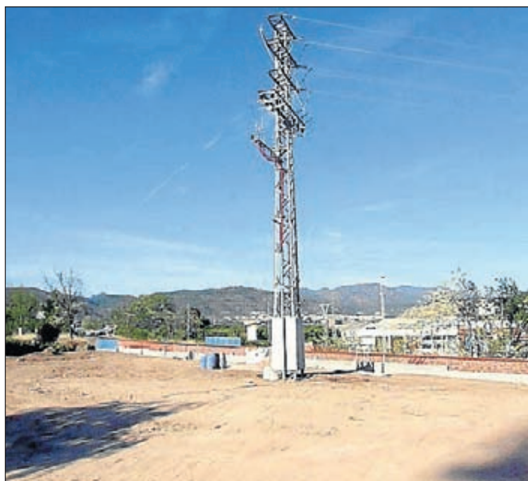
La zona del parque está situada en la parte baja del Sector-1.

El responsable municipal se puso en contacto con gente experta en el tema para escuchar sus consejos y también se visitaron otras instalaciones de este tipo en otros municipios y con esa información y el asesoramiento técnico por parte del personal responsable del Ayuntamiento se planteó la posibilidad de construir un parque para pe-