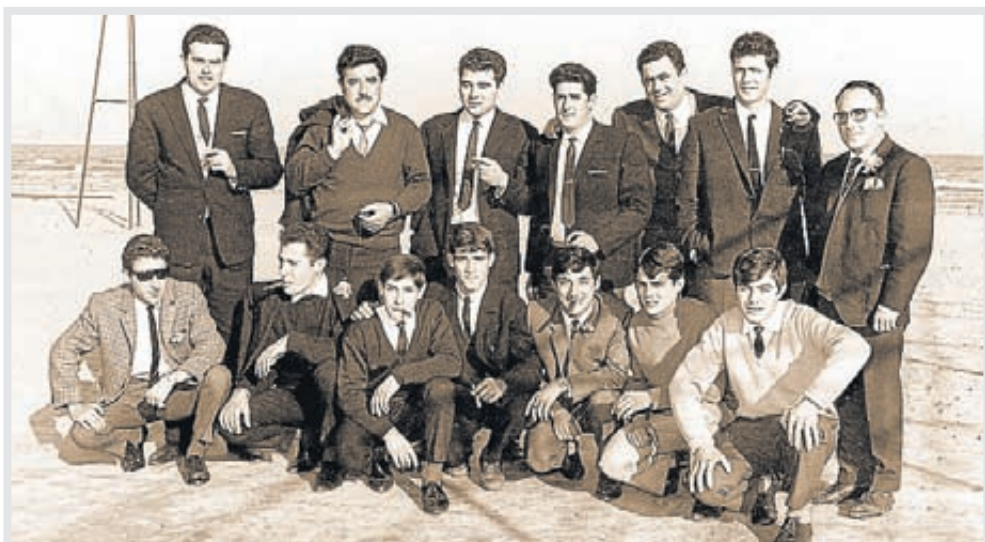
Trabajadores de Iberdrola y electricistas, en el día de la patrona.