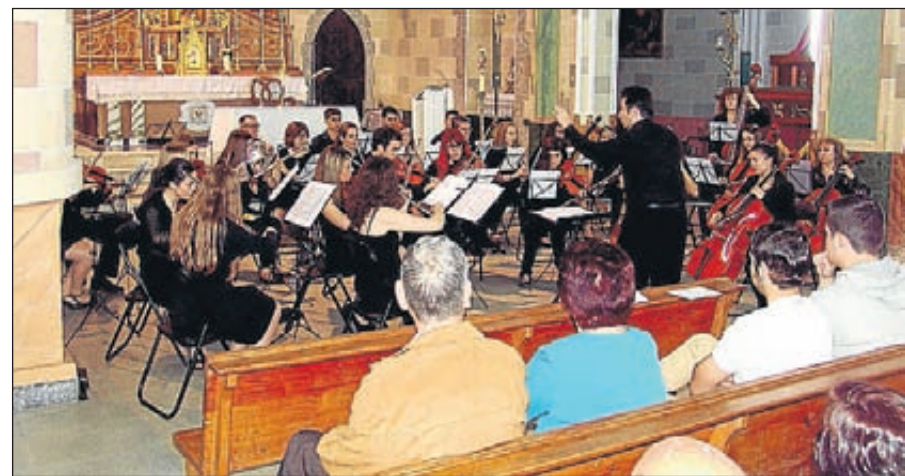
La iglesia de San Francisco puso de manifiesto sus cualidades acústicas.