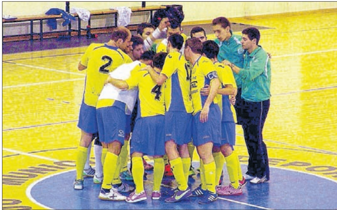
Los chicos del Tecopal CDFS se muestran siempre como una piña y se crecen ante las adversidades.

Ya en el tramo final de encuentro y con la apuesta de portero-jugador por parte de los segorbinos, el encuentro acabó sentenciado debido a la gran de-