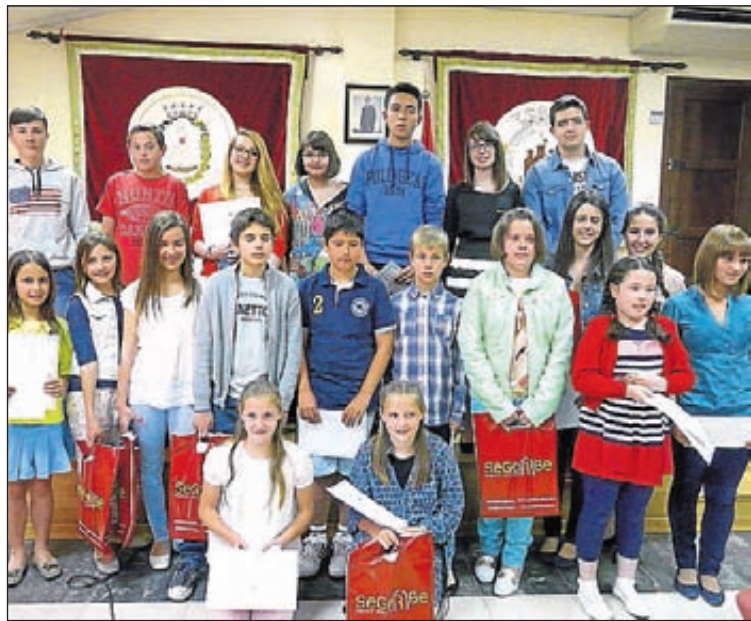
Las caras de satisfacción, protagonistas entre los premiados.

El alcalde de Segorbe cerró el acto mostrando la satisfacción del Ayuntamiento por poder acoger en este certamen literario infantil y juvenil, no solo a los alumnos y alumnas de los centros educativos de Segorbe, sino también a todos aquellos centros de la comarca que participan año tras año en este certamen. Al mismo tiempo, agradeció a los profesores de dichos centros por motivar a sus alumnos a participar.