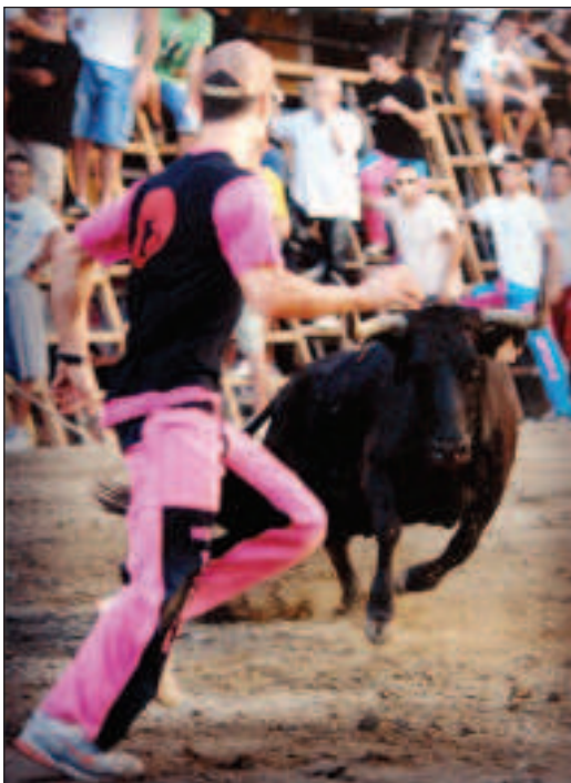
"Leyenda vida" de José Toledo