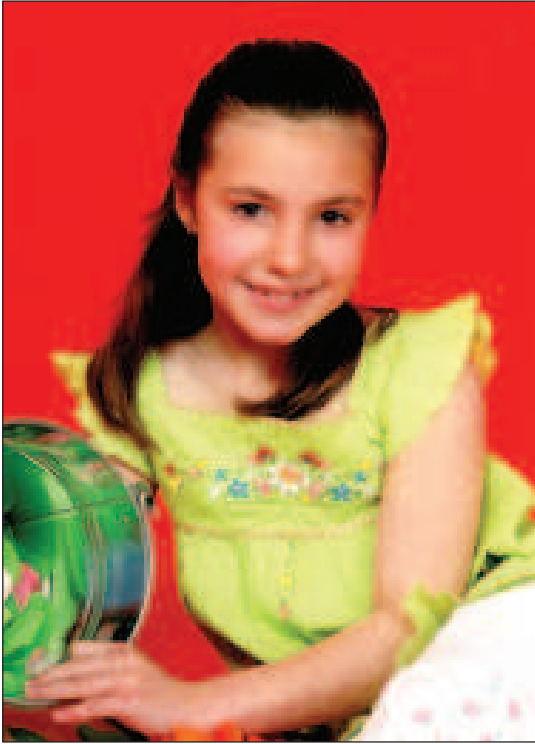
Primera Dama: Cerezo Palao