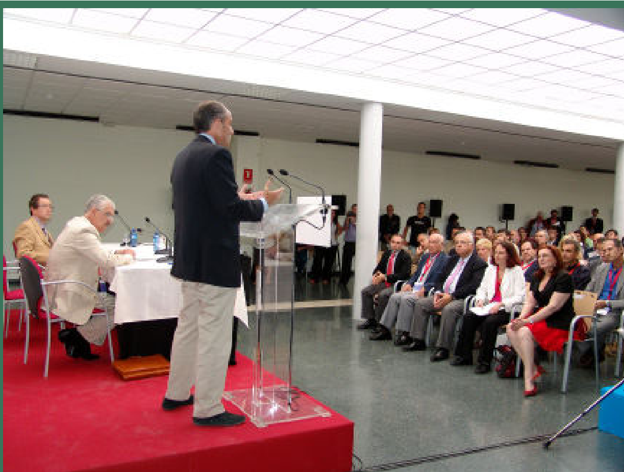
El presidente de la Generalidad inauguró el Congreso Europarc