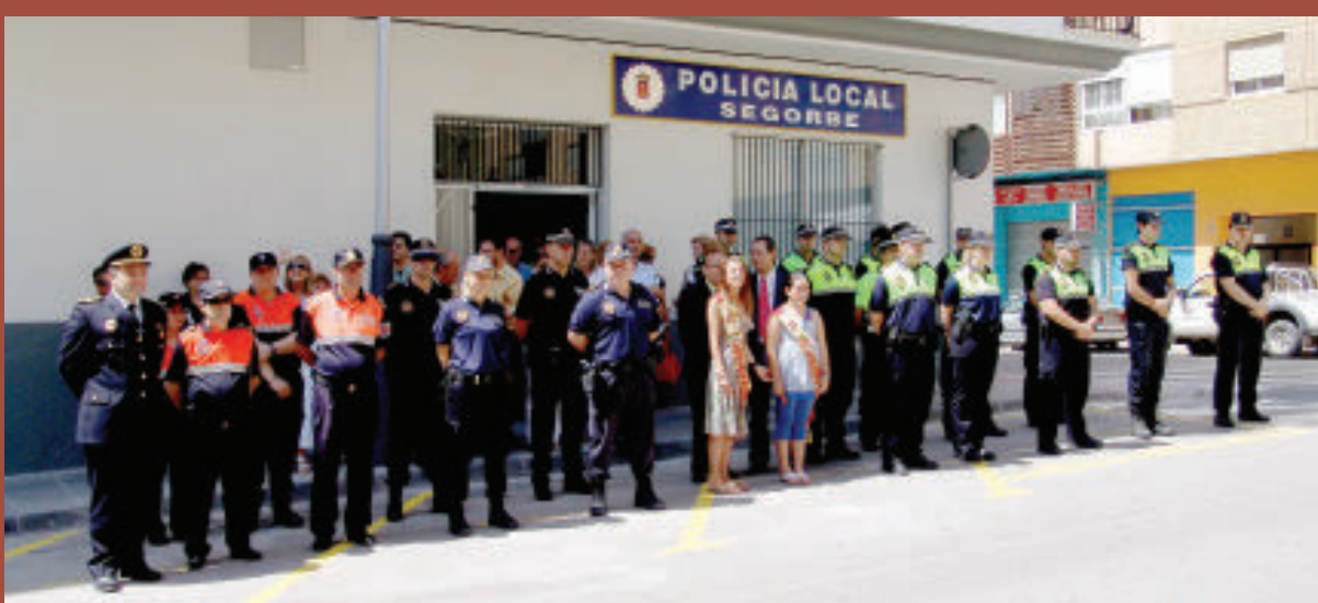
Nueva sede para la Policía Local

El aceite de oliva de Segorbe, recibe una medalla de plata en la ciudad de Los Angeles