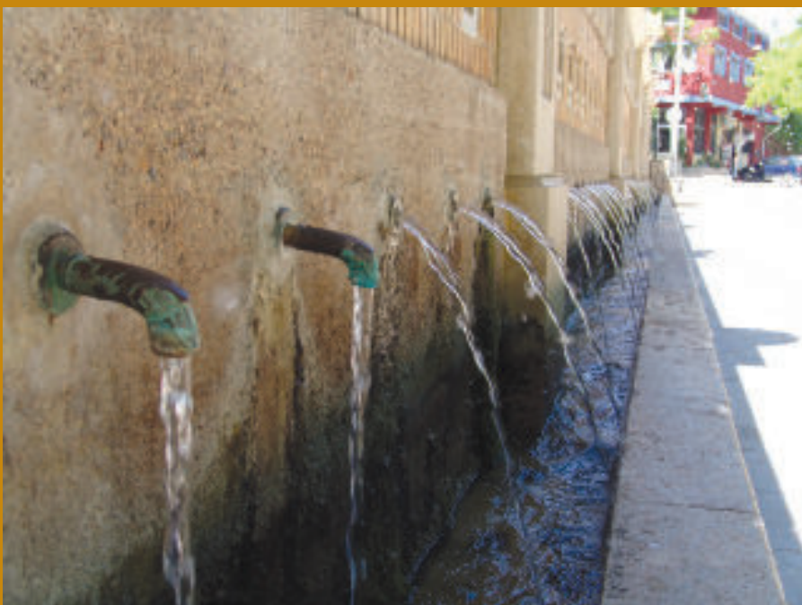
Roban la grifería de bronce de la Fuente de los cincuenta Caños