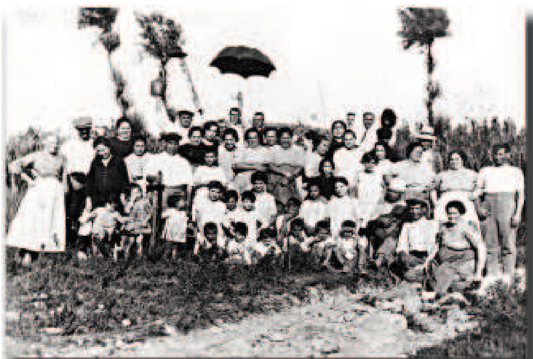
1927. Excursión de amigos a la fuente del Borrego.