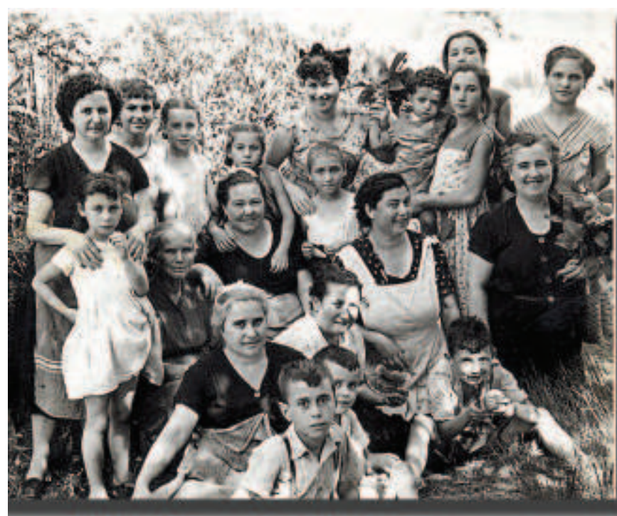
1955 (agosto). Familia en el río Palancia.