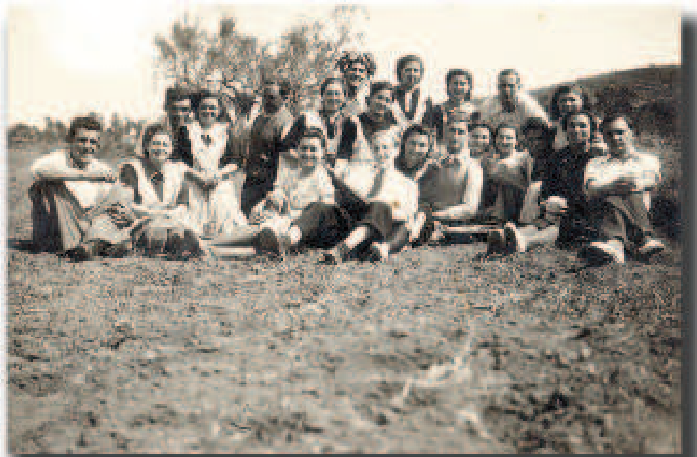
Grupo de amigos de merienda.