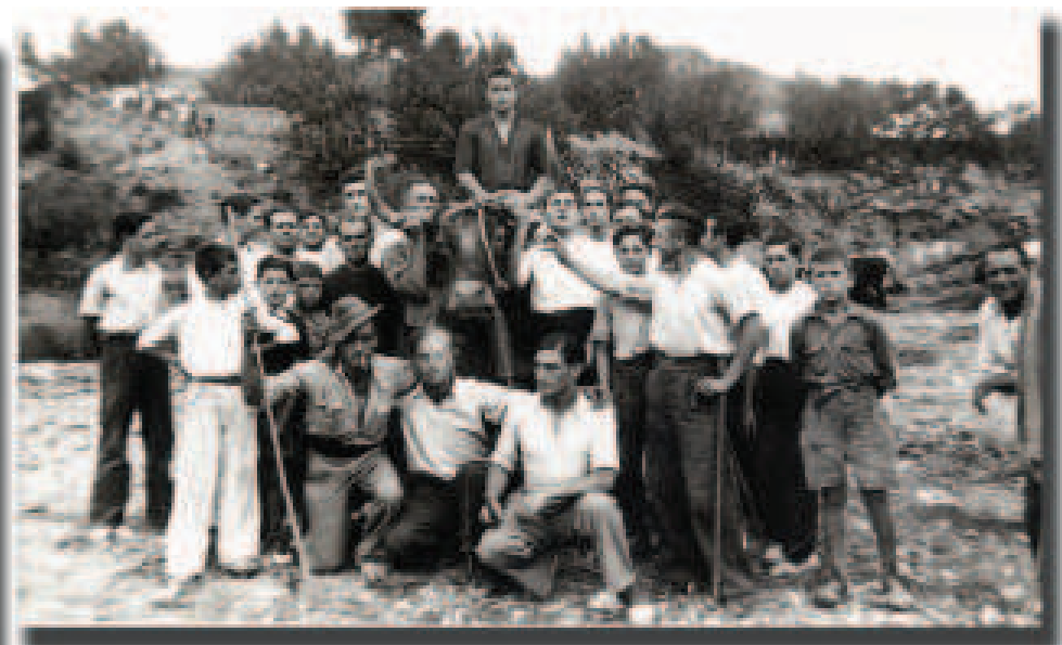
1941. Comisión de toros en el río con el manso.