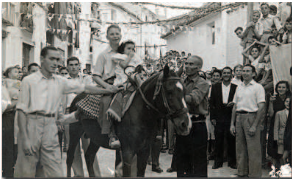
Competición de carreras de cintas en la calle del Romano